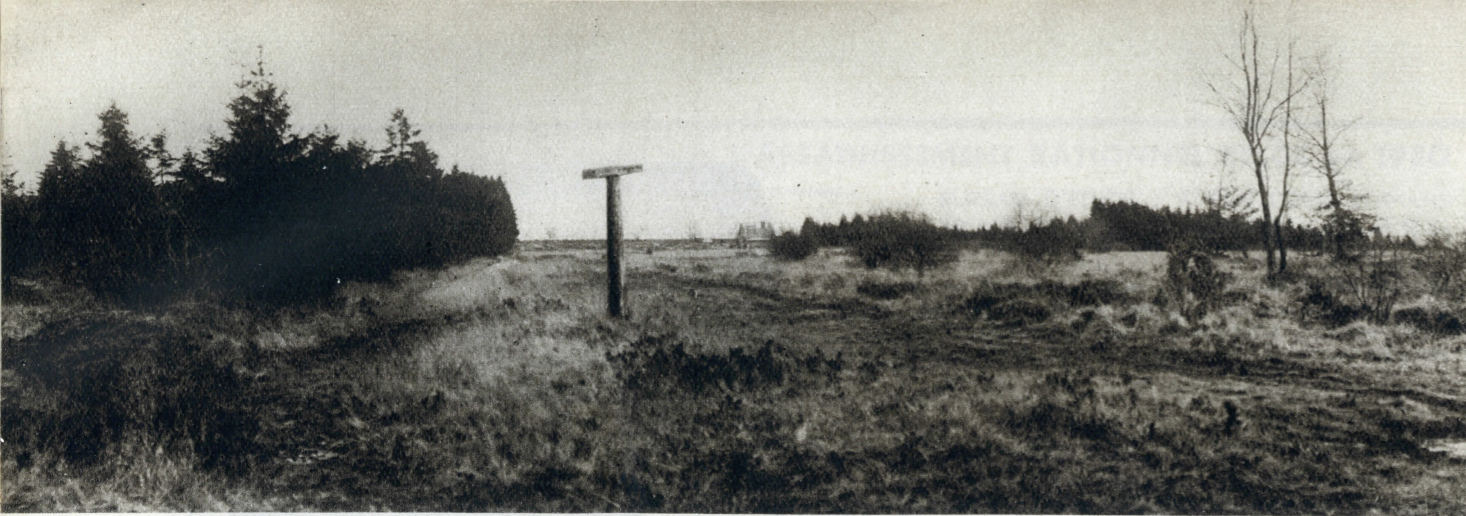
Un aspect des terrains où s'édifieront les coquettes habitations modernes de la cité-jardin de repos « La Cure ».