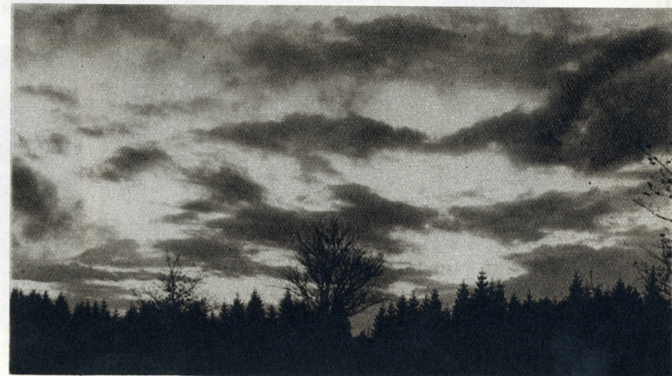
N'est-il pas émouvant ce coucher de soleil sur les Sapinières de la Haute-Fagne ?

Pour tous renseignements sur les terrains, s'adresser à M. Camille Gaspar, « La Cure », 2, rue Rogier, à Spa. Téléphone 298.