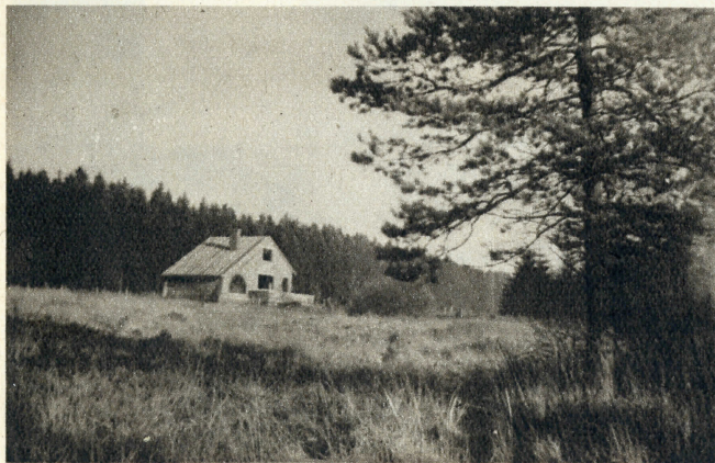
UNE PREMIERE HABITATION VIENT DE S'ÉLEVER DANS LE LOTISSEMENT RUSTIQUE.

Les quatre projets suivants, primés dans chacune des deux catégories, seront présentés aux clients de « La Cure » qui choisiront, pour exécution.